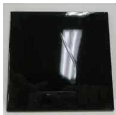
中性トイクレリーナー ルースター

<試験方法> 磁器タイルに、一定量の洗剤または水を滴下し、ペーパーで塗り広げた。その後、水ですすぎ、スタンドに立てかけて、1分間放置して、その濡れ性を観察した。 (当社 研究調べ)